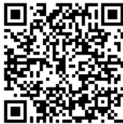
「擁抱心運動」總統府聯歡童樂會