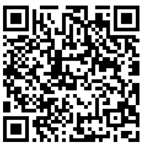
2024 善愛嘉年華活動理念