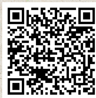
傳愛進校園 - 新北市新莊區中信國小 「沉浸式親職講座」影片